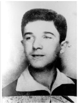
Мордехай Анелевич 3

У серпні 1942 року варшавська організація ППР передала в гетто перший револьвер (у вересні 1942 року пострілами з цього револьвера був поранений шеф єврейської поліції варшавського гетто Юзеф Шерінській) . Загалом у період з 22 липня по 12 вересня 1942 року з гетто було вивезено близько 300 тисяч євреїв.