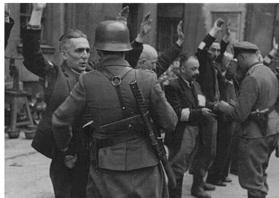
Німецькі солдати арештовують євреїв під час повстання. 6

У ніч з 13 на 14 травня радянські літаки завдали бомбового удару по об'єктах у Варшаві. Наліт тривав дві години, на казарми СС та інші військові об'єкти було скинуто близько ста тонн фугасних і запалювальних бомб. Хоча жертви були і серед євреїв, наліт викликав у них радість. У кількох місцях невеликі групи євреїв, користуючись ситуацією, намагалися пробитися під час нальоту з гетто. Деяким це вдалося.