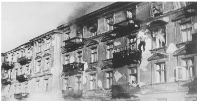
На вулицях повсталого гетто 5