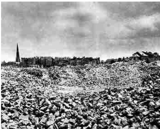
Руїни Варшавського гетто 7

У ніч з 13 на 14 травня радянські літаки завдали бомбового удару по об'єктах у Варшаві. Наліт тривав дві години, на казарми СС та інші військові об'єкти було скинуто близько ста тонн фугасних і запалювальних бомб. Хоча жертви були і серед євреїв, наліт викликав у них радість. У кількох місцях невеликі групи євреїв, користуючись ситуацією, намагалися пробитися під час нальоту з гетто. Деяким це вдалося.