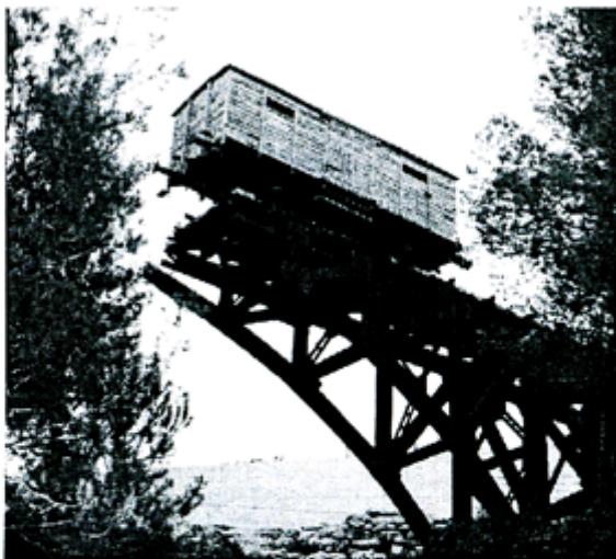
В таких вагонах привозили людей в лагеря смерти