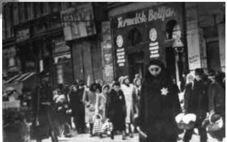
ריכוז יהודים בבודפשט לקראת גירושם לכיוון וינה, בעקבות גזירת הגיוס לעבודות הכפייה (בלה"ג 16121)