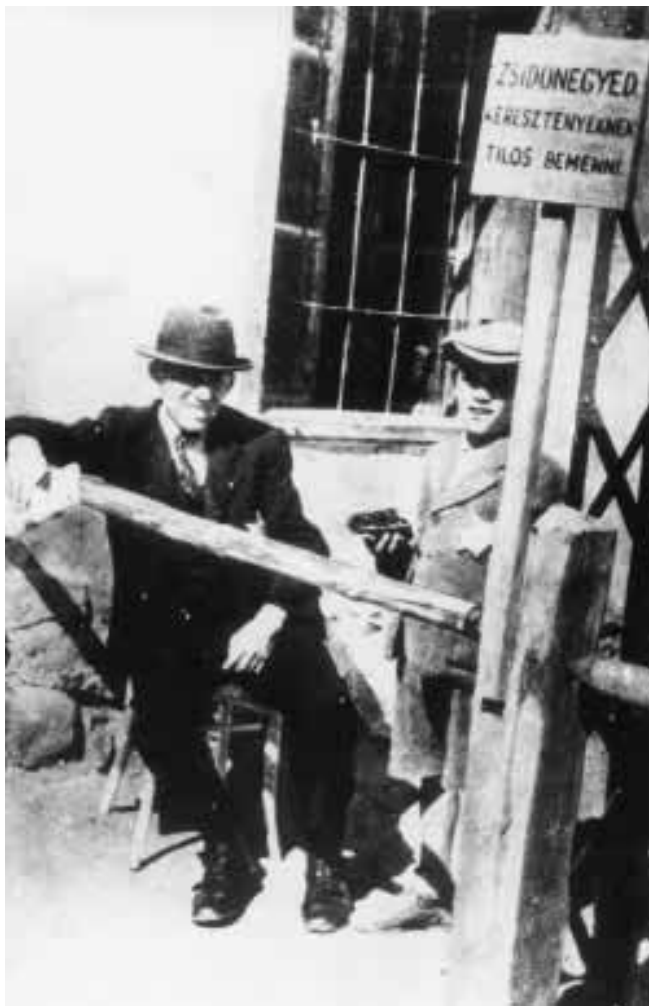
שלט הגבלה בכניסה לגטו באחת מערי השדה בהונגריה. לשון השלט: רובע יהודי. לנוצרים אסור להיכנס. (בלה"ג 16056)

סוף סוף הגיעו אליי הבוקים ... זינדרס פנה לחברו: "ניקח לעצמנו שאלנו את ההגדה הנה ... וזו כמה דברים מהימים יותר. היא כבר לא תצדק להסו". המילים, כמו אלפי מחטים מורעלים, חדרו לתודעתי. מה הכוונה? למה לא אנצדק להגדיי? מה אם כן אלגש?