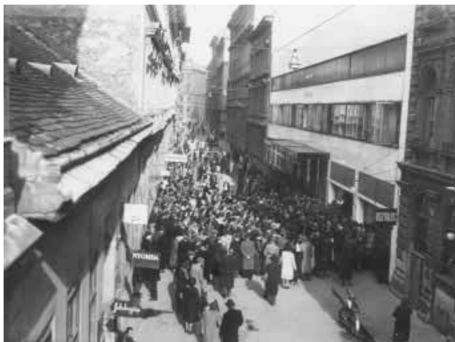
יהודים מתגודדים לפני "בית הזכוכית" ברחוב ואדס, שבו ובבניין הסמוך לו שכנה השגרירות השוויצרית, בתקווה להשיג "שוֹצֶפֶס" (תעודת חסות) (בלה"ג 16080)