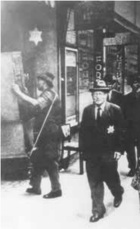
חנות בבעלות יהודית מסומנת במגן-דוד, בודפשט 1944 (בלה"ג 20531)