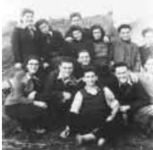
חברי 'השומר הצעיר' מושבת חורף, דצמבר 1943

התכנית מופיעה ביוזמת העמותה לחקר תנועות-הנוער הציוניות בהונגריה