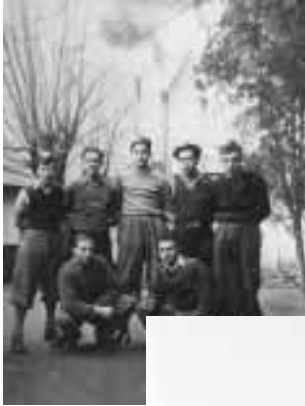
חברי 'הנוער הציוני' מושבת חורף, דצמבר 1943