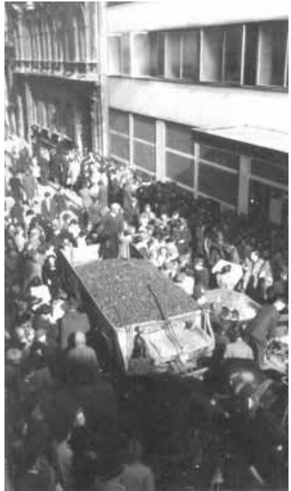
בית הזכוכית בודפשט 1944