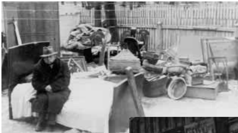
בודפשט, יהודי בגטו. מתחת לתצלום המקורי כתוב: "ללא קורת גג" והכוונה למחסור בדיור בגטו (יד ושם FA-58-24)