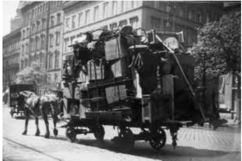
הובלת חפצים של יהודים בדרך לגטו, בודפשט 1944