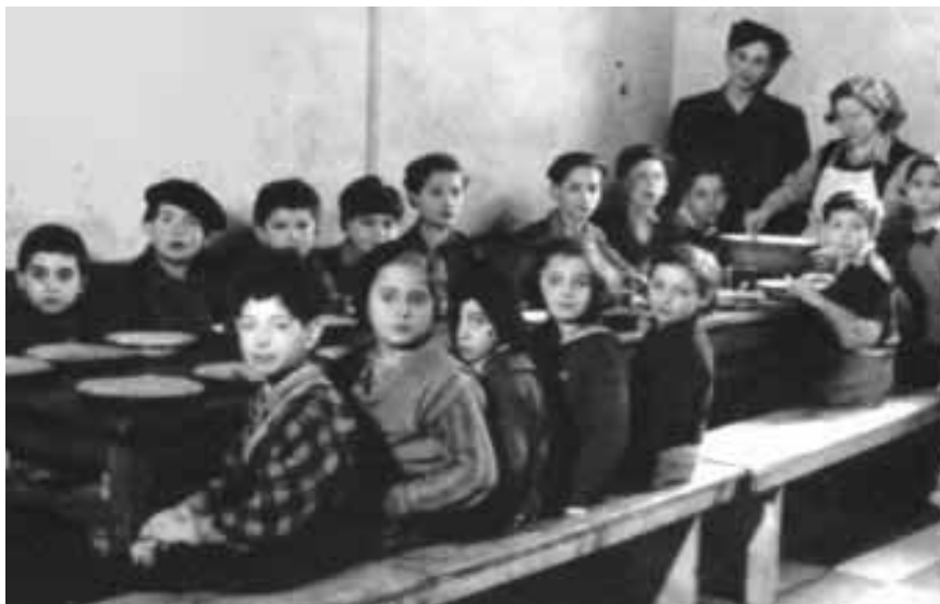
בית-ילדים בבודפשט אחרי השחרור (בנשולם, שם, עמ' 160-161)