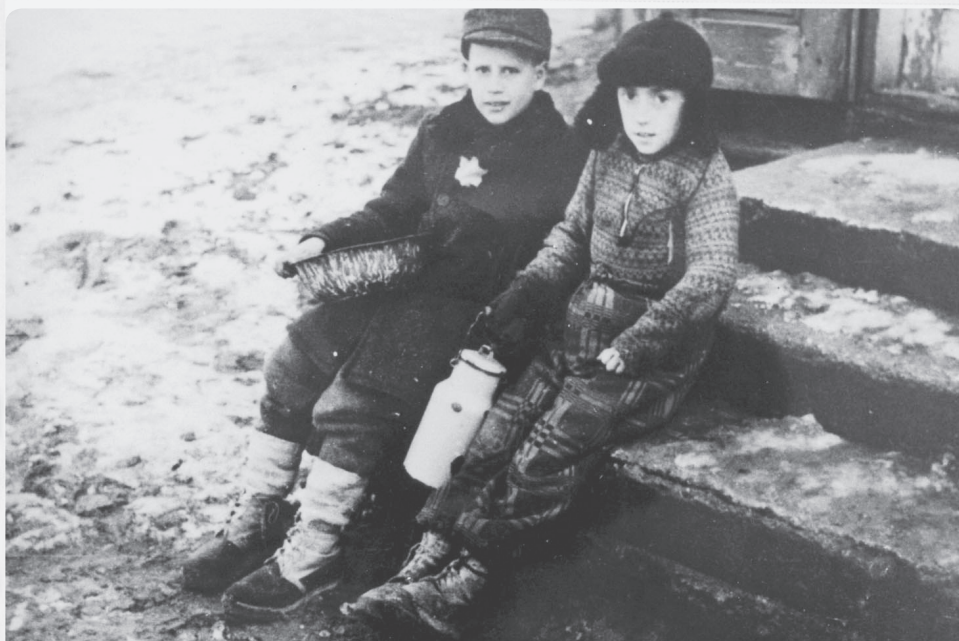
ידיים צחוז זגטו קוזנא, איטא

פעילות זו יכולה להוות סיכום לשיעור זה, או לכל שלושת מערכי השיעור.