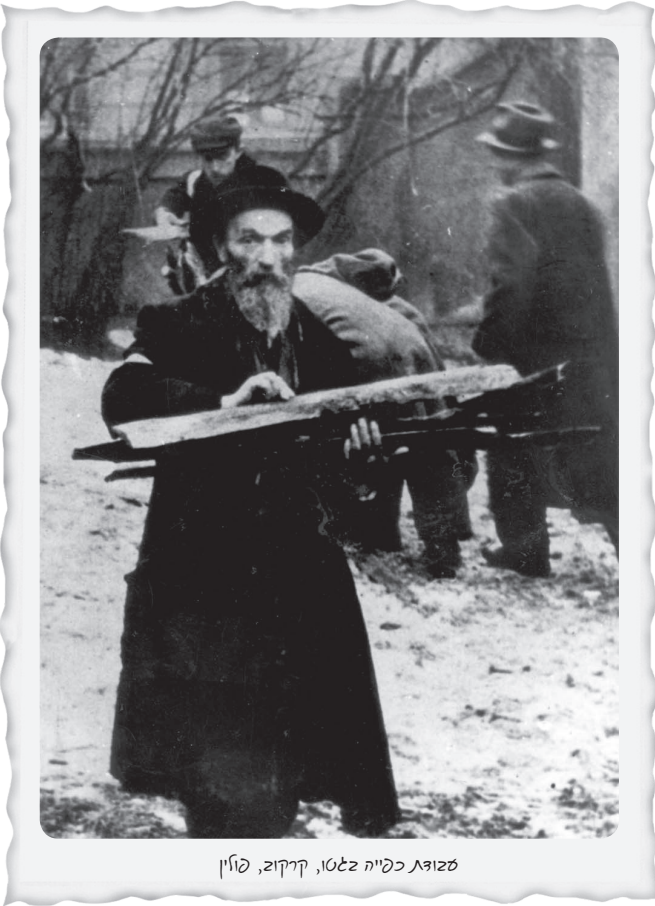
סזואס כפיה זזטו, קרקוז, סזזן

דוד רובינוביץ, יומנו של הנער דוד רובינוביץ, תל אביב 1970, עמ' 58, 66