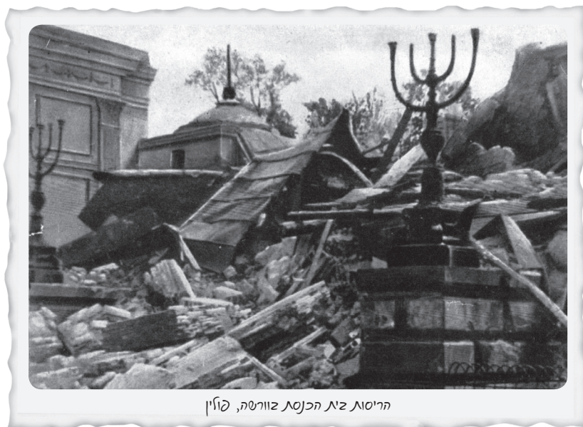
הריסות בית הכנסת זורשה, קוֹז'ין

ימים מעטים לאחר פעולת הצלת ספרי התורה נהרס בית הכנסת על ידי הנאצים.