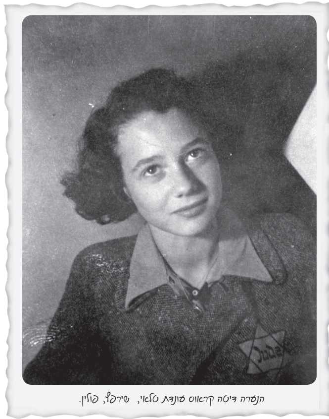
תשרה דיטה קראוס סונצט טלאי, שירפף, פוזין.