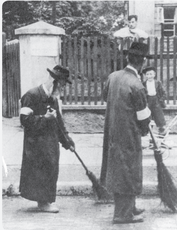
יהודים מצדדת כפייה, קרקוב, פולין

כיצד הגיבו היהודים להיסלמות המלאונית של אזוניהם מחייהם?