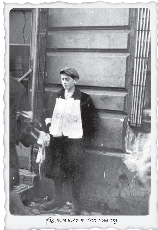
נער אוכר סרטי יד זלטו ורשה, פולין.