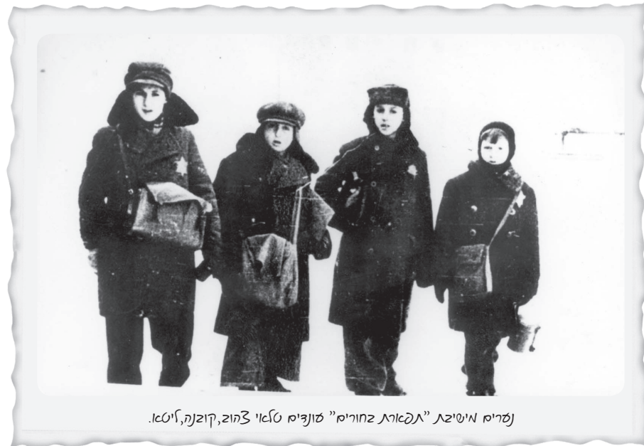
נצרים מיטיצט "אפאריג זחורים" עונציס טלאי צהוב, קוצנא, איטא.

דב פרייברג, שריד מסוביבור, תל אביב 1988, עמ' 39-40