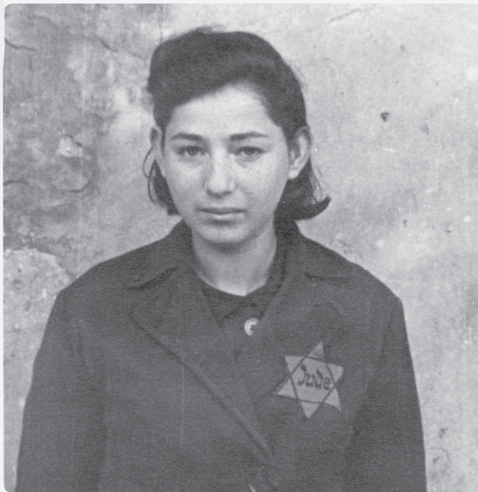
נשרה יהודייה ממספרת פאצ'ר, טשיצ'ין, פולין