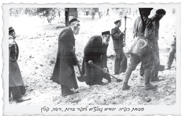
סצנת כפייה: יהודים מאזכרים אחרון זורוח, ורשה, פולין