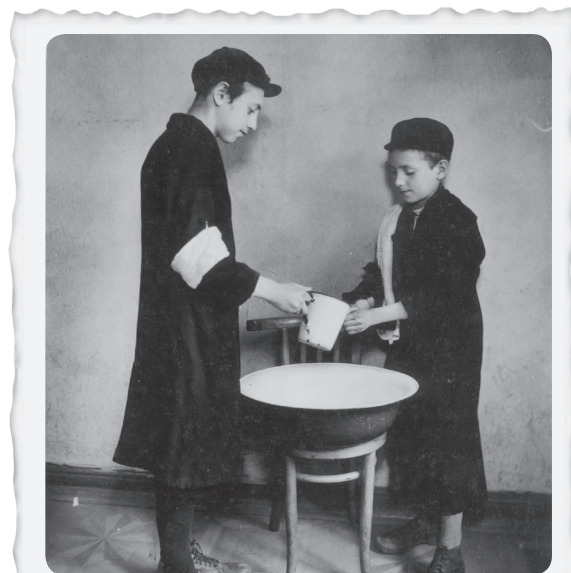
זנים נטאיים יזייס זעלנצט הלנה, לאחד מהם סרט לרוס, ורשה, פולין.

בכל מקום התפרסם הצו המחייב את נשיאת אות הקלון בזמן אחר, וגם צורת אות הקלון הייתה שונה ממקום למקום. לעתים היה זה מגן דוד צהוב ("הטלאי הצהוב"), ולעתים סרט לבן עם מגן דוד כחול. כמו כן גיל חובת סימון אות הקלון היה שונה ממקום למקום, והיו מקומות שבהם אף ילדים צעירים ביותר היו מחויבים בענידתו.