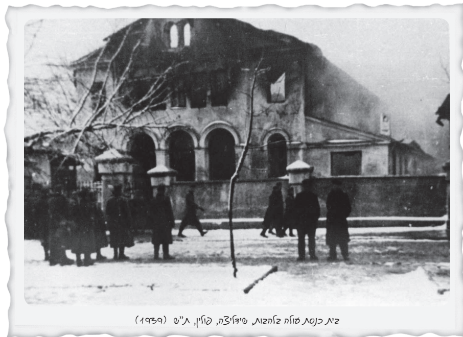
זית כנסת סוזה לזחזוח, טיפוזיה, פולין, א"ש (1939)

מצום מרליש בן אברהם כי "עמנו נשאר חסר מגן"?