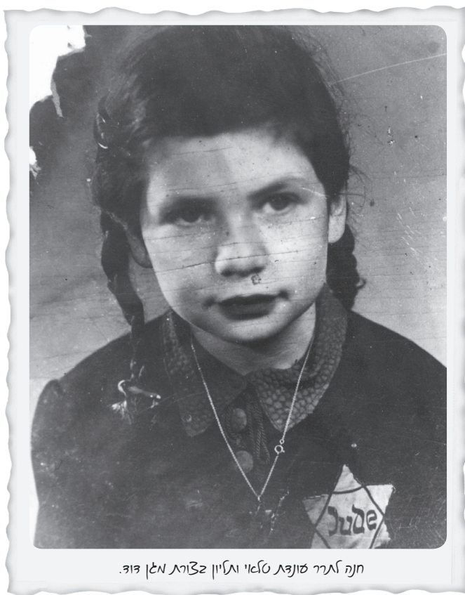
חנה ארר סונצט טלאי וג'יין צ'ורט אלן צ'וד.

מיאס שנוואט הייתה תלויה על צווארי שרשרת זהב עם מגן דוד בתוך עיגול. אבא שם לי אותה על הצוואר כשראה אותי לראשונה. בלעדיה לא הלכתי לשום מקום. [...] אני זוכרת שהיינו שתי חברות, ביום הראשון יצאנו עם הטלאי הזה, הוצאנו גם את השרשרת שלנו (גם לה הייתה שרשרת עם מגן דוד), והלכנו ככה גאות שאנחנו יהודיות. מתוך עדותה בארכיון יד ושם