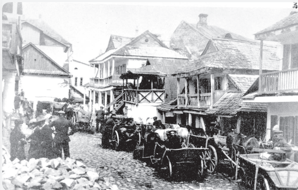
יהודים זש'י סלאו וסלאוניהם זככר השוק היטן זשייה קרימנינה, סולין

גזרות אלו הרעו באחת את מצב היהודים, בודדו אותם ובעיקר השפילו אותם. מלבד גזרות אלו שגזר השלטון הגרמני סבלו היהודים מרדיפה והתעללות מצד חיילים וכוחות הביטחון הגרמנים, כשלצדם פועלים פעמים רבות גם אזרחים. יהודים נתפסו ברחובות, הוכו והושפלו, ובמקרים רבים גולח באכזריות זקנם של גברים רבים, ביניהם רבנים ומנהיגים חשובים.