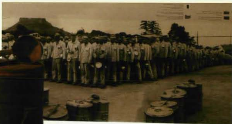
מכל מרק מקורי ממחנה גרוס-רוזן שיוצג במוזיאון החדש לתולדות השואה. תרומת מוזיאון גרוס-רוזן, פולין

עם המידע שניתן למבקרים שילבה דורית הראל גם ממד חושי, והוא מעניק למבקרים רושם כללי