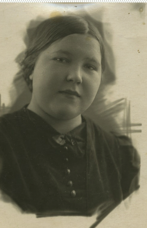
אלכסנדרה קירובסקיה-פבלובה, חסידת אומות עולם