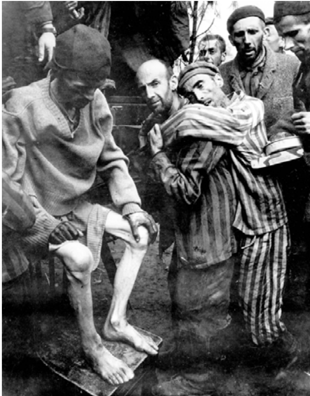
| אסירים ממתנינים לפינוי לבית חולים שדה, 1945, וובלין, גרמניה