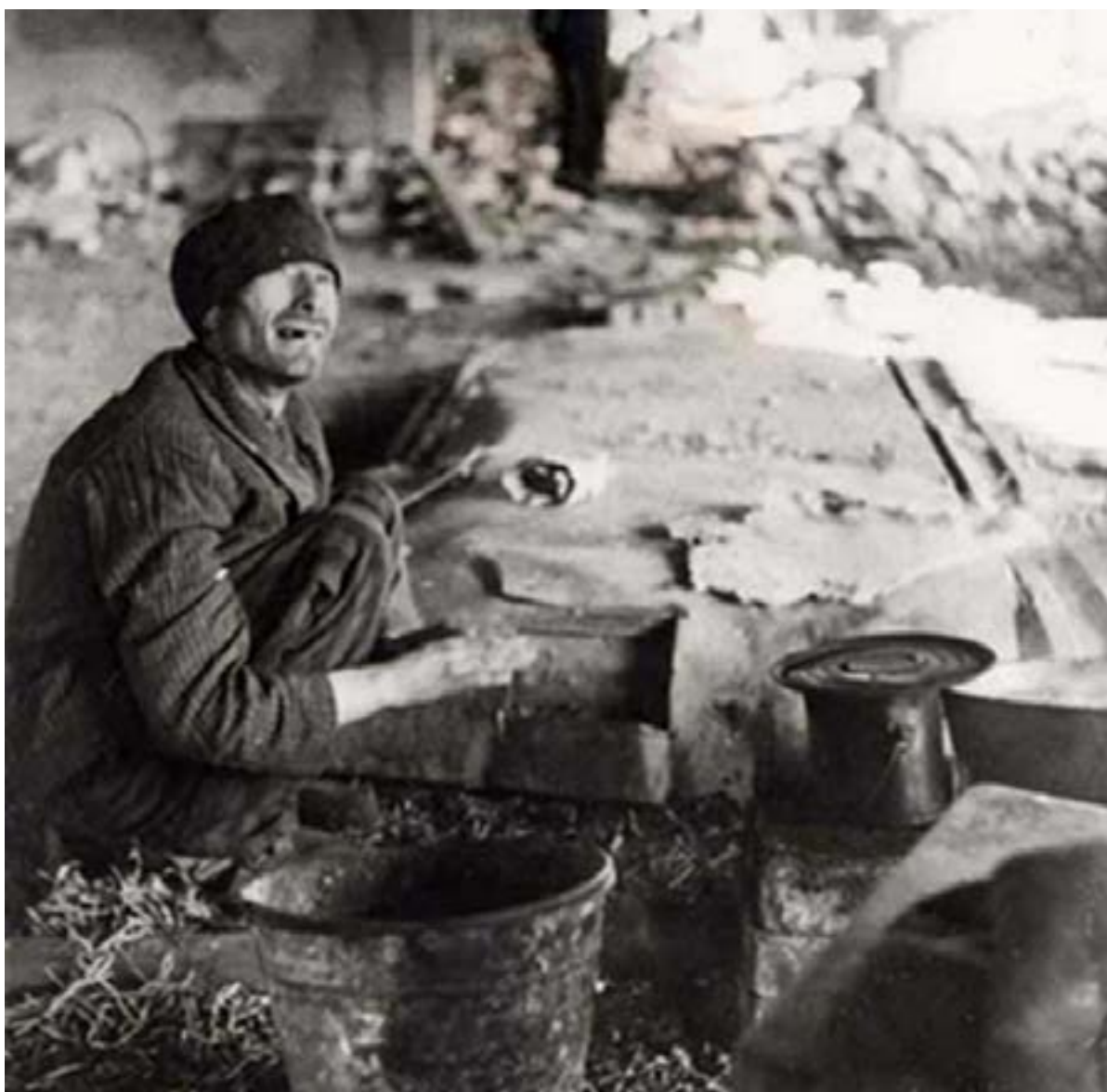
| ניצול ליד סיר תפוחי אדמה, אפריל 1945, נורדהאוזן, גרמניה