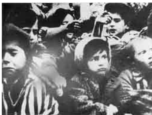
Dzieci w obozie, wyciągają ręce w czasie wyzwolenia, Auschwitz, Polska.