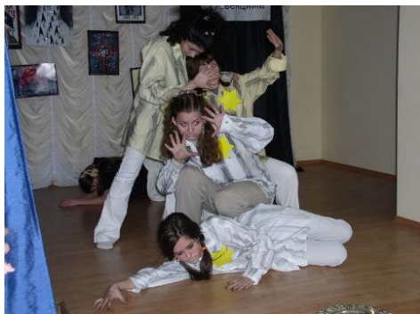
Przedstawienie przygotowane przez grupę taneczną Zaporozhye JCC w ramach projektu Maraton Pamięci, Ukraina, 2005 r., „Tkuma” (Central Ukrainian Holocaust Foundation).

27 stycznia 2005 r. Central Ukrainian Holocaust Foundation - "Tkuma" zorganizowała projekt znany jako „Maraton Pamięci”, mający na celu podniesienie świadomości na temat Holokaustu w ukraińskich miastach i miasteczkach. Przygotowane obchody obejmowały uroczystość wręczenia nagród uczniom biorącym udział w konkursie dotyczącym Holokaustu; Marsze Żywych do miejsc związanych z Holokaustem, obrady okrągłych stołów z udziałem uczniów/studentów i osób publicznych; konferencje prasowe z przedstawicielami międzynarodowych i lokalnych mediów organizowane w związku z 60. rocznicą wyzwolenia obozu koncentracyjnego Auschwitz- Birkenau. W Odessie, obchody Dnia Pamięci o Holokaucie były połączeniem prezentacji artystycznych obrazów i scen z powieści Elie Wiesela - ocalonego z Holokaustu laureata nagrody Nobla. W całym kraju w uroczystościach tych uczestniczyli przedstawiciele władz państwowych i lokalnych.