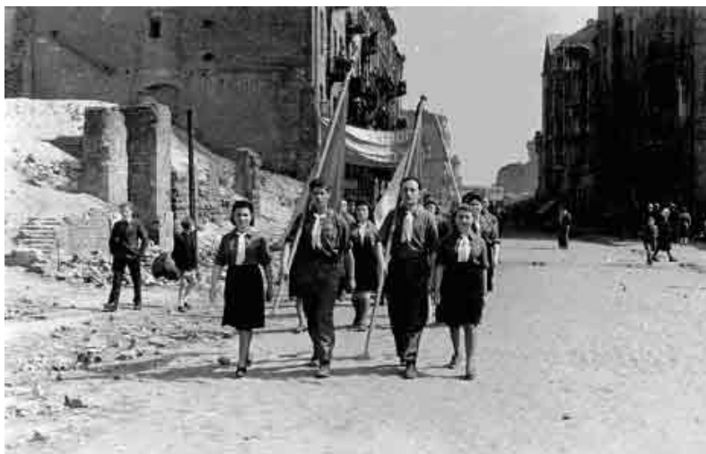
Powojenna Warszawa, Polska, marsz pamięci ku czci ofiar Holokaustu.

Dni Pamięci o Holokauście są stosunkowo nowym zjawiskiem w niektórych krajach, podczas gdy w innych mają już długotrwałą tradycję. Rządy państw inicjują i organizują oficjalne ceremonie oraz specjalne sesje parlamentarne organizowane dla upamiętnienia Holokaustu w formie Dni Pamięci o Holokauście. Uroczystości te są szeroko komentowane przez lokalne, krajowe i międzynarodowe media.