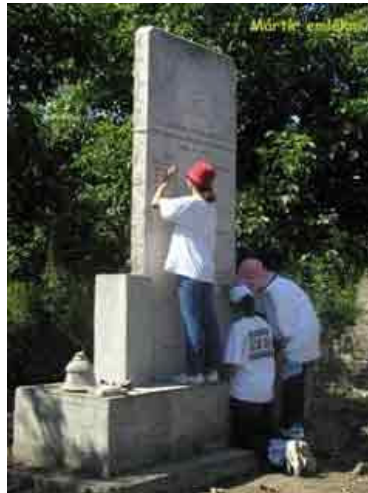
Uczniowie porządkują zaniedbany żydowski cmentarz w Szob, Węgry, 2002 r. (Szkoła Żydowska Lauder Javne w Budapeszcie)