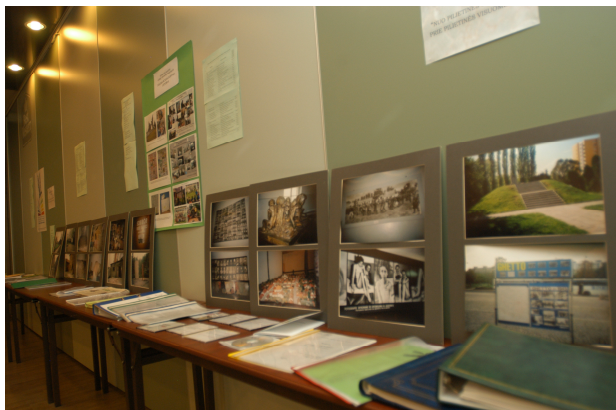
Wystawa uczniowskich projektów na konferencji "Żywa historia Żydów litewskich" zorganizowanej w Dniu Pamięci Narodowej o Holokaucie na Litwie, 23 września 2004 r.

LXXXI LO im. A. Fredry z Warszawy, w czasie całego roku szkolnego, realizowała duży projekt na temat pamięci o Holokaucie. Zakończenie projektu miało miejsce w Dniu Pamięci o Holokaucie 19 kwietnia. Jest to data wybuchu powstania w Getcie Warszawskim. Przygotowując wystawę na temat Warszawskiego Getta uczniowie wybrali i stworzyli materiały dotyczące miejsc pamięci znajdujących się w pobliżu szkoły, takich jak pomnik Getta Warszawskiego i Umschlagplatz (miejsce, skąd Żydzi byli wywożeni do obozów zagłady). Uczniowie przygotowali również wystawę na temat wszystkich synagog, które niegdyś istniały w Warszawie.