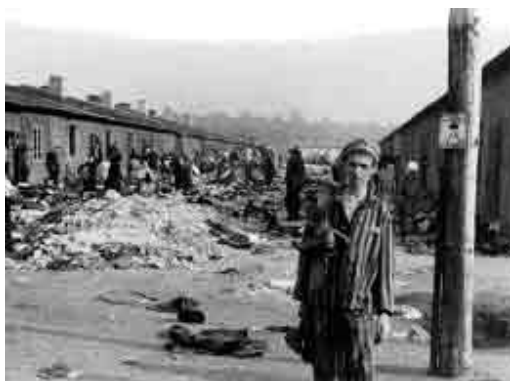
Były więzień niedaleko obozowych baraków, Bergen-Belsen, Niemcy.

Nauczyciele mogą zechcieć zorganizować spotkania z żyjącymi świadkami (szczególnie z osobami, które przeżyły Holokaust jak również z wyzwolicielami i ratującymi), którzy tego dnia mogą opowiedzieć uczniom o swoich losach w czasie II wojny światowej. Świadectwa opowiadane na żywo mają wielką moc i mogą stanowić głębokie doświadczenie edukacyjne dla uczniów. Wcześniej nagrane świadectwa również mogą być skutecznym narzędziem edukacyjnym. Nauczyciele mogą chcieć skupić się na tym, co uczniowie wynieśli z wysłuchania świadectw ocalałych i świadków Holokaustu.