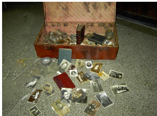
Ta walizka, część projektu obchodów Dnia Pamięci o Holokauście, została stworzona przez uczniów z Klubu Pamięci, Vlaicu Voda National College, Rumunia, październik 2004 r.