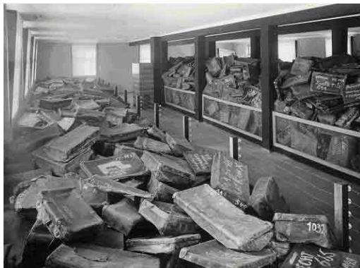
Auschwitz, powojenna Polska, walizki w Muzeum, Yad Vashem.