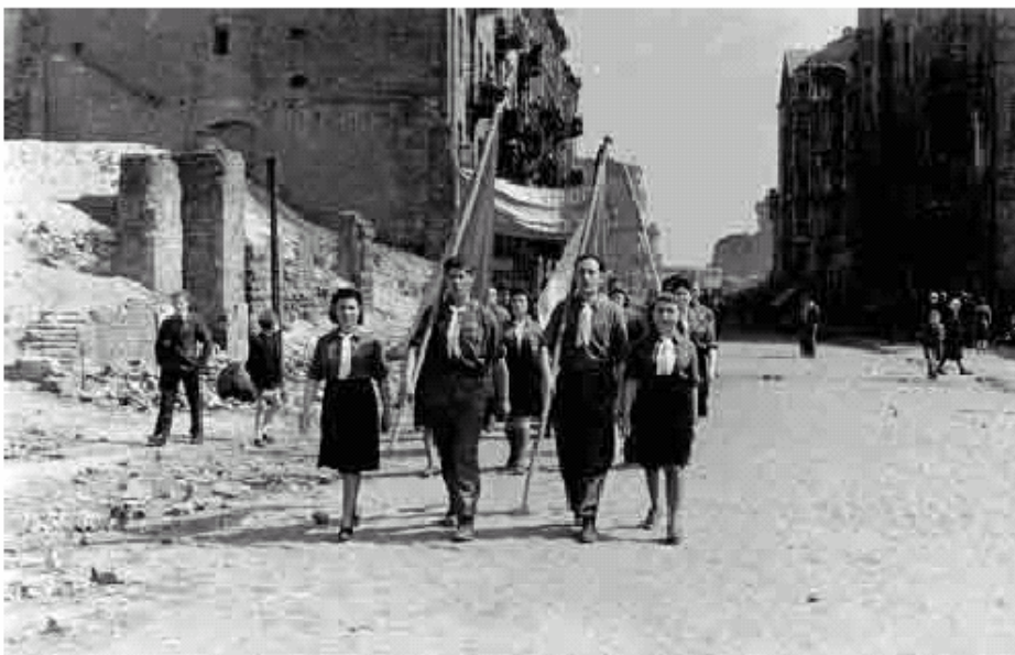
Varsavia, Polonia, dopoguerra, Marcia in Memoria delle vittime dell’Olocausto.

I giorni della Memoria della Shoah sono un fenomeno relativamente nuovo in alcuni Paesi, mentre in altri vantano lunghe tradizioni. I Governi hanno indetto ed organizzato cerimonie ufficiali e speciali sessioni parlamentari in occasione della giornata della memoria dell’Olocausto, che sono state propagate diffusamente dai media locali, nazionali ed internazionali.