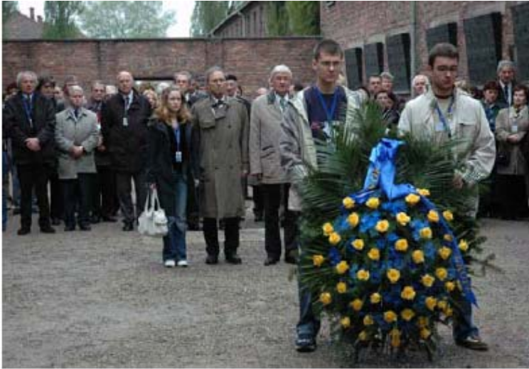
Deposizione di una corona al Muro della Morte nel cortile del Block 11 ad Aushwitz I-Stammlager. Alcune delegazioni di giovani e i ministri dell'Educazione di 48 Stati membri della Convention Culturale europea, partecipanti al seminario internazionale "Insegnare la Memoria attraverso l'eredità Culturale", Cracovia e Auschwitz- Birkenau, Polonia, 4-5 Maggio 2005.

Nell'Ottobre del 2002 i Ministri dell'educazione dei Paesi membri del Consiglio D'Europa hanno varato una risoluzione che impone agli stati membri di istituire una "Giornata della Memoria" per commemorare l'Olocausto in tutte le scuole dei rispettivi Paesi 1 . In oltre, durante la sessantesima assemblea generale plenaria nel Novembre 2005, le Nazioni Unite hanno stabilito il 27 Gennaio come giornata internazionale della commemorazione per onorare le vittime dell'Olocausto, e i paesi membri sono stati sollecitati a sviluppare programmi educativi per tramandare il ricordo di questa tragedia alle future generazioni. 2