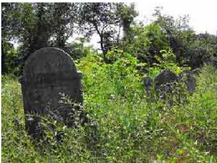
Studenti che puliscono un cimitero ebraico abbandonato in Szob, Ungheria 2002 (Scuola della Comunità ebraica Lauder Javne di Budapest)

La Lauder Javne Jewish Community School di Budapest, Ungheria, organizza un programma estivo di una settimana per studenti, al fine di ripulire un cimitero ebraico, ormai abbandonato. Gli studenti ripuliscono le tombe dalla vegetazione che vi cresce sopra e raddrizzano le pietre tombali cadute. Inoltre interpretano le date degli epitaffi e cercano di ricostruire la storia dell'allora esistente comunità ebraica. Alla fine dell'attività, i partecipanti ricordano tutti coloro che hanno perso la vita nell'Olocausto, che determinò la fine di una comunità ebraica che all'epoca era fiorente. Al progetto si sono unite alcune scuole e comuni.