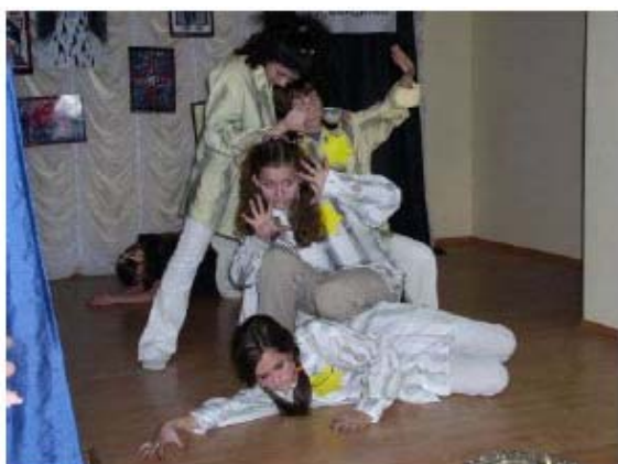
Performance del gruppo di ballo JCC di Zaporozhye durante la Maratona della Memoria, Ucraina 2005, Tkuma (Fondazione sull’Olocausto dell’Ucraina Centrale)

Il 27 Gennaio del 2005 la “Tkuma”, Fondazione Centrale sull’Olocausto dell’Ucraina, ha organizzato un progetto conosciuto come “Maratona della Memoria”, con lo scopo di incentivare la coscienza dell’Olocausto in dozzine di grandi e piccoli centri in Ucraina. Tra i vari eventi, una cerimonia di premiazione per gli studenti che hanno partecipato ad una competizione sull’Olocausto; “Le marce dei Viventi” attraversano i siti storici dell’Olocausto; tavole rotonde tra studenti e personalità pubbliche e un conferenza stampa con i rappresentanti dei media locali ed internazionali in occasione della celebrazione del sessantesimo anniversario della liberazione di Aushwitz-Birkenau. Ad Odessa la commemorazione ha previsto una combinazioni di immagini e storie artistico letterarie di Elie Wiesel, un sopravvissuto all’Olocausto e premio Nobel. Personalità Statali e locali da tutto il paese hanno preso parte a questi eventi.