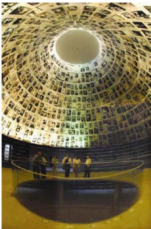
La Sala dei Nomi, nel Nuovo Museo Storico dell'Olocausto presso lo Yad Vashem. Lo Yad Vashem, assolvendo al compito di commemorare l'eredità di ogni singolo Ebreo che morì per mano dei Nazional Socialisti e dei loro collaboratori, ha raccolto "Le Pagine della Testimonianza" dalla metà degli anni cinquanta. Le Pagine della Testimonianza, presentate dai sopravvissuti, parenti o amici delle vittime, sono conservate quali memoriali permanenti.

Si consigliano attività che si concentrino su storie di persone realmente esistite, i cui nomi e volti siano stati già identificati o che possano essere identificati attraverso ricerche (per esempio, coloro che abitavano in una città o un quartiere, ex insegnanti o studenti di una scuola). Mettere in risalto i volti, i nomi e le vite delle vittime dell'Olocausto restituisce la dignità di coloro che sono stati assassinati. Gli insegnanti, facendo riferimento alle vittime come a degli esseri umani provenienti da comunità ben radicate piuttosto che come statistiche di persone morte nelle camere a gas o sepolte nelle fosse comuni, possono far comprendere il tessuto sociale multiculturale delle comunità ebraiche in Europa tra le due guerre.