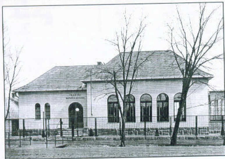
A Fried Pál Napközi Otthon utcai homlokzata 59

ruhákat, cipőket...” 58 használták. A napköziben 20 gyermeket tudtak egyszerre elhelyezni. Reggelenként a fürdőmedencében langyos vízben megfürösztötték őket, majd az étkezés, játék és pihenés váltogatta egymást. Az akkor készült képek tanúsága szerint igen tágas, szép, tiszta teret kaptak a munkásnyák gyermekei.