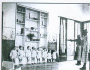
A napközi otthon élete – játék és foglalkozás 61