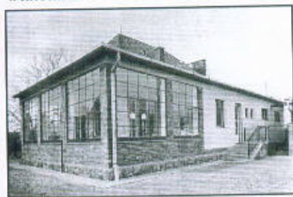
A napközi otthon udvari homlokzata 60