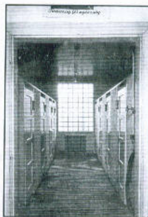
A zuhanyfürdő folyosója 76