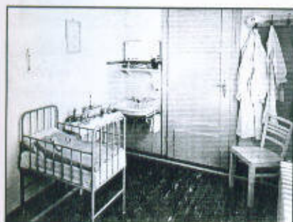
Elkülönítő – betegszoba 63