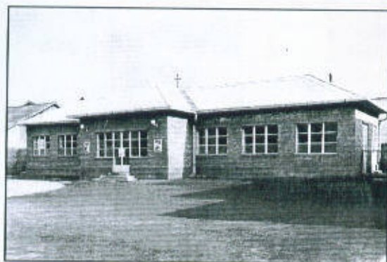
Munkásjóléti épület – homlokzati látkép 74

Törődtek munkásaik egészségével. A leírás és a fennmaradt képanyag szerint zuhanyzókkal biztosították a rendszeres tisztálkodás lehetőségét. A fürdőépületben lévő modern orvosi rendelőben a munkások – az Országos Társadalombiztosítási Intézettől, az OTI-től függetlenül is – állandó egészségügyi felügyeletben részesültek.