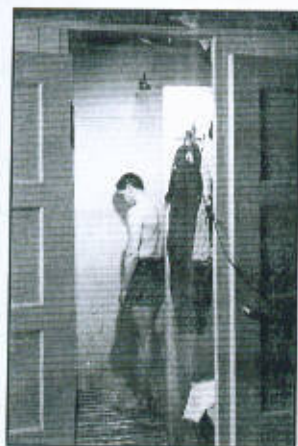
Tusolás közben 75