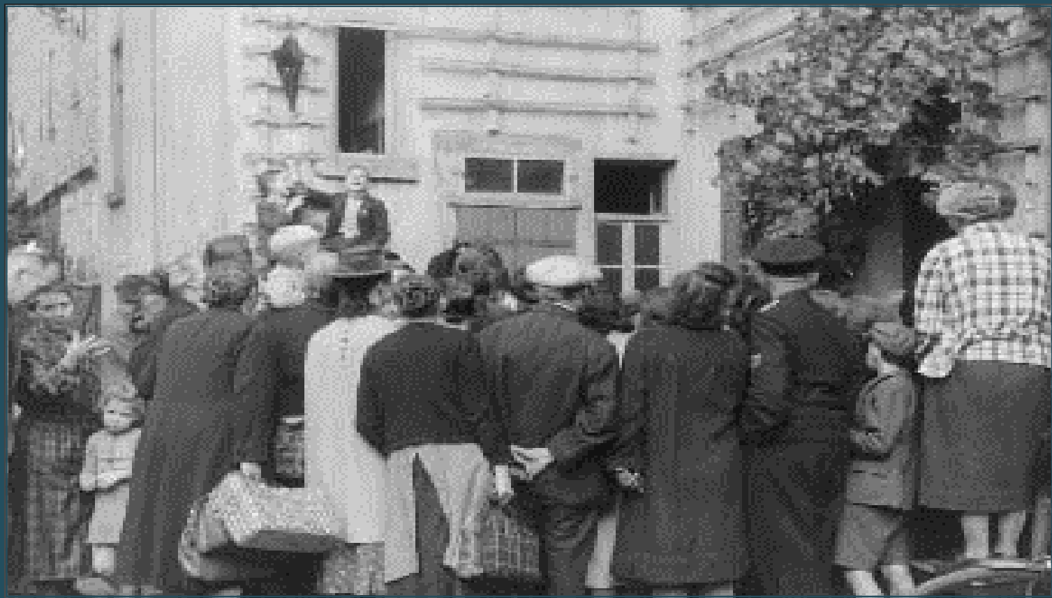
Hanau, Duitsland. Openbare verkoop van eigendommen door Joden achtergelaten na hun deportatie