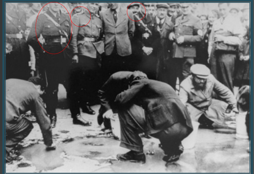
Wenen, Oostenrijk, 1938