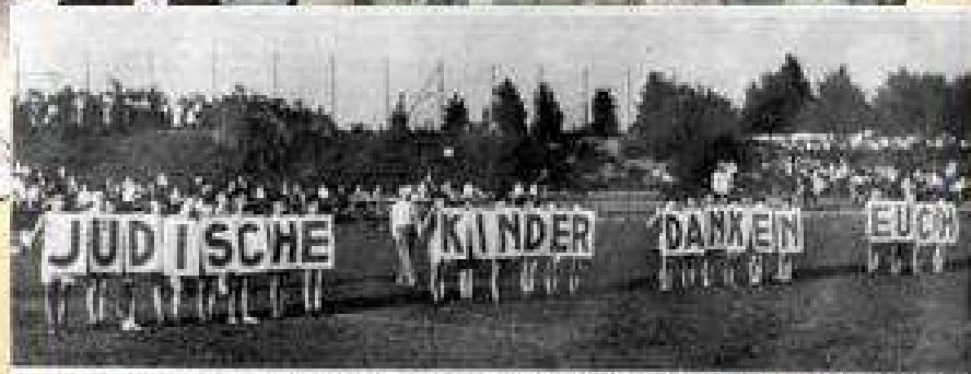
Zum Sportfest „Für das jüdische Kind!“ unter dem Protektorat der Jüdischen Gemeinde in Berlin

Handwritten text in German script, likely a name or date, written in dark ink on the yellowed photo.