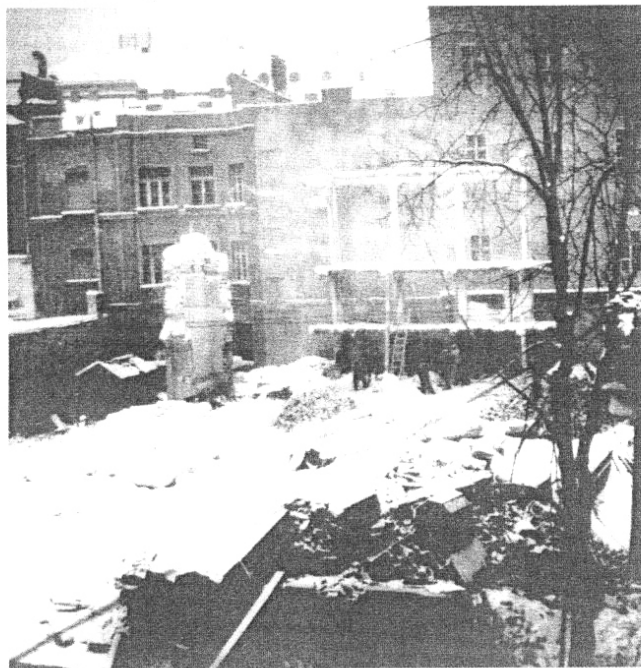
Rusenje sinagoge (od 10. listopada 1941. do travnja 1942.g.)

Uobičajena fraza da mir "liječi ratne rane" ne odnosi se na židovske zajednice u Hrvatskoj i Bosni i Hercegovini. Te rane koje su posljedica gubitka četiri petine članova ne mogu postati manje bolne. Hrvatska se židovska zajednica nije mogla obnoviti: većina predratnih općina nije mogla uopće nastaviti s radom poslije 1945. godine. Većina se sinagoga ne koristi, kulturni je život mnogo siromašniji, sportske aktivnosti gotovo da ni ne postoje. Oni koji su planirali genocid nad Židovima uvelike su postigli svoj cilj i zato nove generacije hrvatskih Židova teško mogu stresti sa sebe težak teret sjećanja na vrijeme ustaške strahovlade.