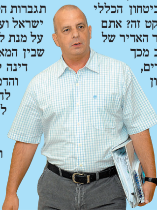
דיסקין. "אחריות כבדה"

ה', ראש בית הספר הגבוה לניהול ופיקוד, הקריא בטקס דברים בשמו של ראש השירות, יובל די-סקין: "מדוע אתם, עובדי שירות הביטחון הכללי של מדינת ישראל, משתתפים בפרויקט זה? אתם כאן משום שמיזם זה הוא חלק מהאתגר האדיר של שימור זיכרון השואה ולא פחות חשוב מכך – שימור תודעת השואה. עלינו, כיהודים, כישראלים וכעובדי שירות הביטחון הכללי, לעשות זאת משום שנקודת המבט על מאורעות היסטוריים הולכת ומשתנה במרוצת השנים בשל התפתחותם של אינטרסים פוליטיים, לאומיים וגישות אקדמיות מחקריות דוגמת הפוסט מודרניזם, הרביזיוניזם והרלטביזם.