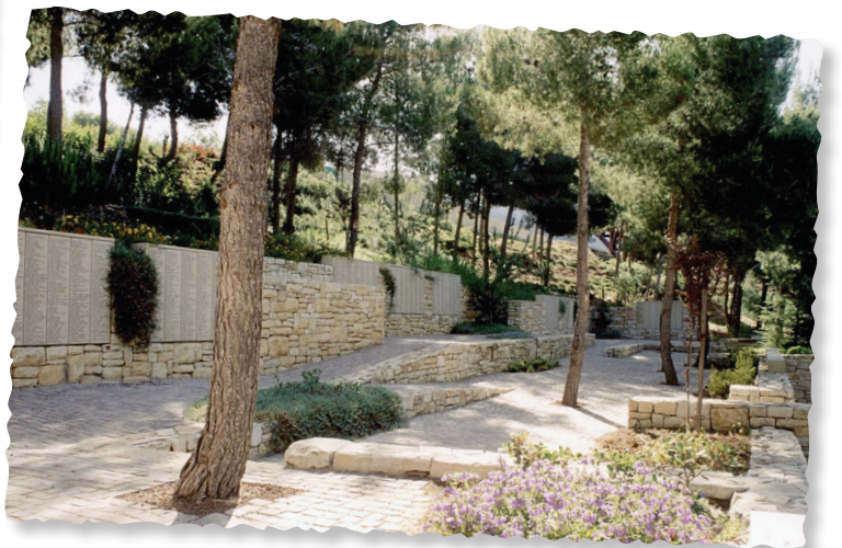
Árbol plantado en Yad Vashem, en honor al movimiento clandestino danés