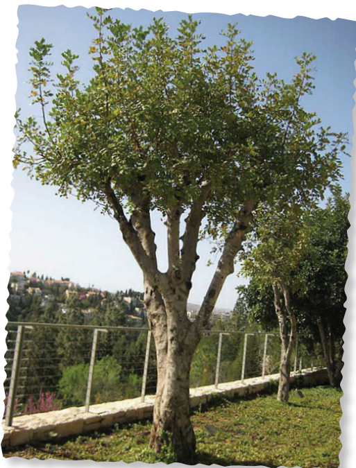
El Jardín de los Justos en Yad Vashem, Jerusalén