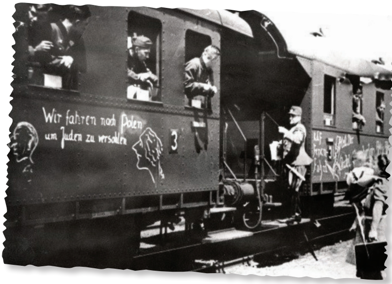
Soldados alemanes en camino al frente En el vagón dice: "Viajamos a Polonia para golpear a los judíos", septiembre de 1939

Archivo fotográfico de Yad Vashem, 138G02