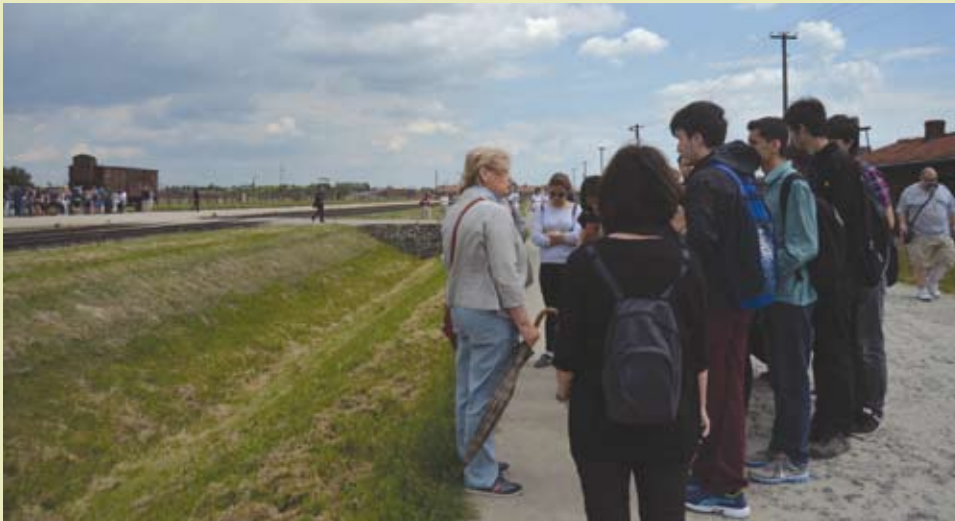
■ תלמידיו של מקמילן בסיור באושוויץ-בירקנאו

בשיאו של הפרויקט לקח מקמילן את הקבוצה לביקור היסטורי בקרקוב ובמוזאון אושוויץ-בירקנאו