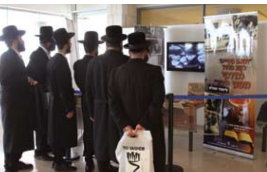
■ אנשי חינוך מהמגזר החרדי מתבוננים בתערוכה בבית הספר הבין-לאומי להוראת השואה.

הכותבת היא ראש המדור החרדי במגמה להכשרת מורים בבית הספר הבין-לאומי להוראת השואה.