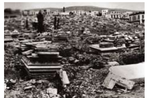
■ בית העלמין היהודי העתיק שנהרס בסלונקי

עם זאת קשפיצקי מביע גם קורטוב של אהדה לילדים ולנשים בטרבלינקה. סיפורו של ילד אחד זעזע אותו במיוחד: "ילד בן שמונה עמד והתחנן להיפרד מאביו שהגיע איתו. הוא סירב להתפשט עד שייפרד מאביו שעמד בצד האחר של הדלת. הוא לא יכול היה להגיע אליו, האב עמד תחת משמר אחד, ובנו תחת משמר אחר. אבל קרה לו נס. קורפורל אוקראיני שניצב בצריף זז קמעה. הוא הבין את המילים הפולניות ומילא את משאלתו של הילד, הוציא אותו החוצה והביאו אל אביו. האב הרים אותו על ידיו, נשק לחייו הרכות והוריד אותו ארצה. רגוע חזר הפושע הקטן לצריף ופשט את בגדיו בעצמו. משאלתו האחרונה התמלאה".