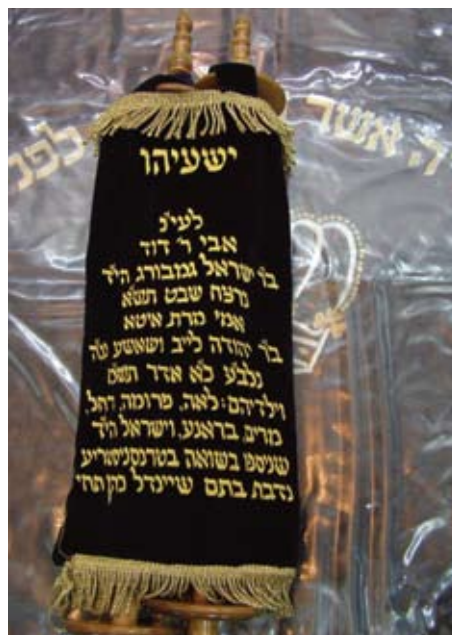
■ מעיל לספר תורה שנרקמו בו שמות של קרבנות שואה

או נוספו לכתובת במצבה המציינת את שמותיהם של בני משפחתו שנרצחו בשואה.