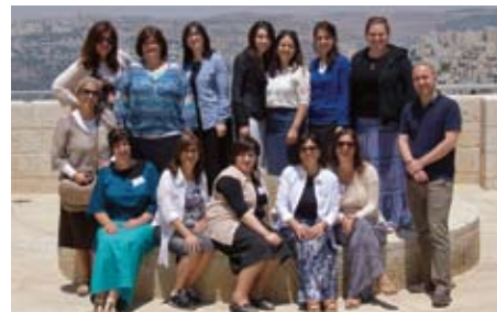
■ מחנכות יהודיות מארצות הברית: "הסמינר חולל שינוי משמעותי בחייהם".

הכותבת היא מנהלת המגמה להכשרת מורים בבית הספר הבין-לאומי להוראת השואה.