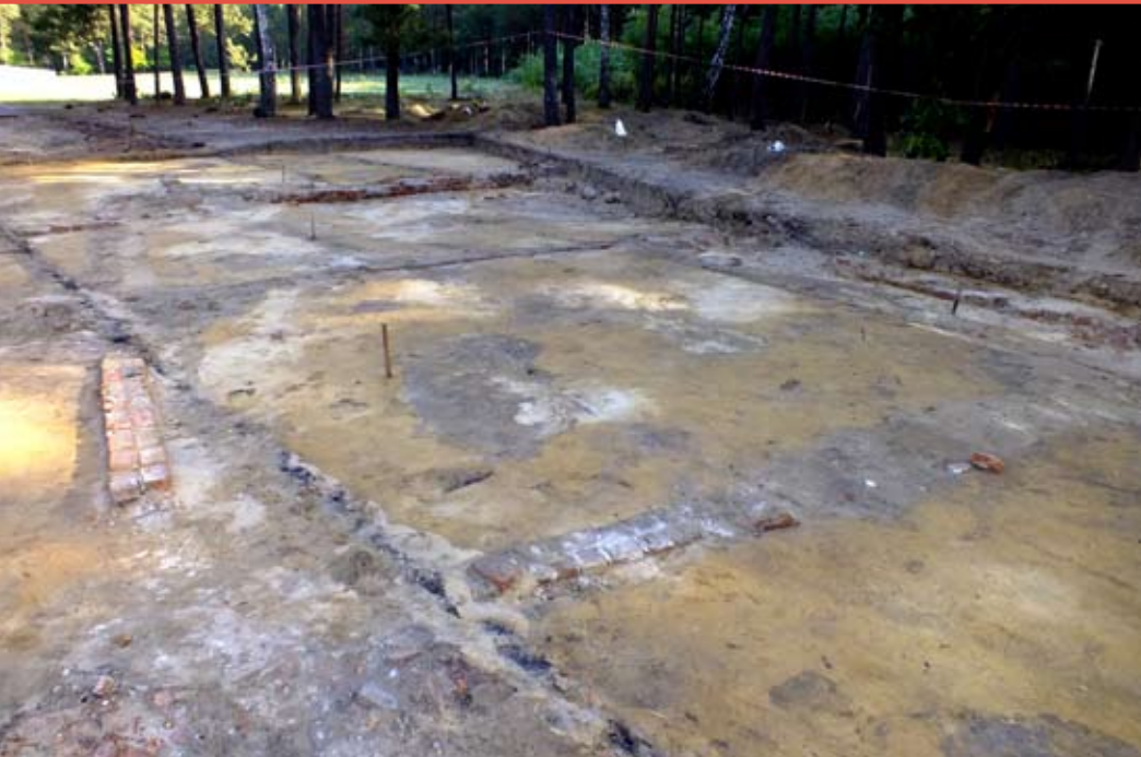
■ אזור תאי הגזים שנחשף בספטמבר 2014

חפירות ארכאולוגיות חשפו את תאי הגזים בסוביבור