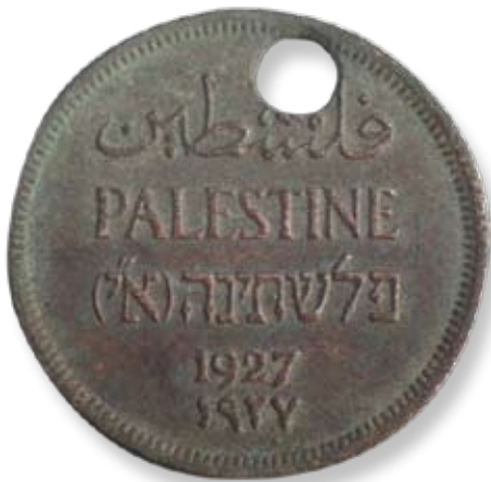
■ מדליה שנמצאה באזור תאי הגזים בסוביבור: כנראה היא נשלחה או הובאה מארץ ישראל לפני המלחמה.

על הממצאים הארכאולוגיים בסוביבור כתבו יורם חימי וויצ'ך מזורק במאמרם "מחקר ארכאולוגי בסוביבור: חשיפת שרידי מחנה מוות נאצי" (יד ושם – קובץ מחקרים, מ"א:2, תשע"ד, עמ' 43-78). החשיפה של תאי הגזים היא "השיא של עבודת החפירות במחנה", אומר ד"ר דוד זילברקלנג, חוקר בכיר במכון הבין-לאומי לחקר השואה והעורך הראשי של יד ושם – קובץ מחקרים. על השאלה כיצד נותרו הפריטים הללו שלמים אחרי השמדת המחנה ב-1943 משיב ד"ר זילברקלנג: "ייתכן שהגרמנים לא ראו אותם. ייתכן גם שהיהודים שעבדו בסילוק הגופות הטמינו את הפריטים הללו באדמה בכוונה כדי שאחר כך מישהו