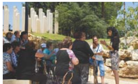
■ גמלאים מקריית מוצקין בסיור ביד ושם

הגמלאים שמחו על ההזדמנות להשתתף בפעילות משמעותית בנושא השואה ונהנו מחוויית הדרכה מרגשת שהמחישה את ייחודו של המוזאון בהצגת דמותם של קרבנות השואה בצד סיפור התמודדותם