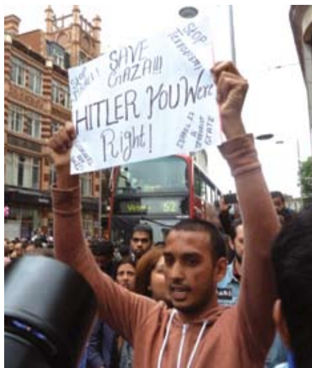
הפגנה אנטישמית בלונדון, יולי 2014