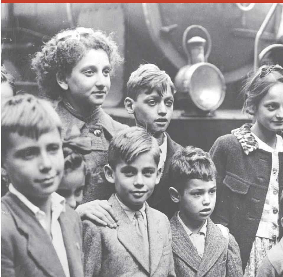
ילדים יהודיים המוברחים מצרפת הכבושה עומדים ליד רכבת בליסבון, פורטוגל, 1941.

כמעט בכל זיכרונותיהם של ניצולי השואה מובא מקרה אחד לפחות של עזרה וסיוע הדדי של יהודי ליהודי אחר