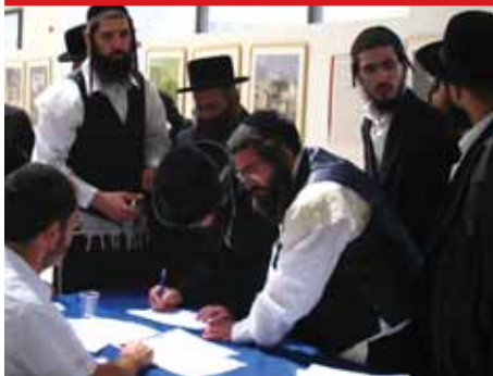
רישום לכינוס מורים ומלמדים בתלמודי תורה