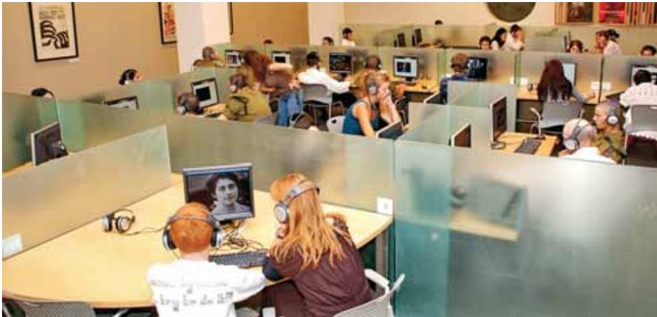
■ מרכז הצפייה ביד ושם

■ הארכיון של מכון קרן השואה באוניברסיטת דרום קליפורניה (מיסודו של סטיבן שפילברג) העביר ליד ושם העתקים של כ-52,000 עדויות של ניצולים ועדים אחרים מ-56 מדינות ב-32 שפות שתועדו משנת 1994 עד שנת 2000, והן נגישות כעת במרכז הצפייה. עדויות אלו התווספו לאוסף העדויות של ארכיון יד ושם שיש בו כ-10,000 עדויות וידאו שצולמו משנת 1989 ואילך ולאוסף של כ-5,000 סרטי תעודה וסרטי עלילה העוסקים בשואה שהופקו עד היום ברחבי העולם. כיום האוספים הללו נגישים לקהל הרחב במרכז הצפייה של יד ושם באמצעות חיפוש מוצלב המציג תוצאות חיפוש משלושת האוספים.