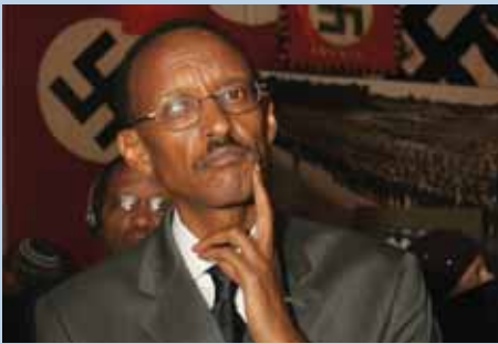
נשיא רואנדה פול קאגמה ביקר במוזאון לתולדות השואה.

■ ציון שנת ה-60 למדינת ישראל מעורר עניין בעולם, וגם יד ושם מושך אליו מבקרים מכל העולם. בשבוע השני של חודש מאי ביקרו ביד ושם פוליטיקאים, סופרים, שחקנים ואנשים חשובים אחרים, בהם נשיאי רואנדה, אלבניה, סלובניה, מונגוליה ובורקינה פאסו, נשיא האספה הכללית של האו"ם ויושב ראש הסנאט של בית הנבחרים של קזחסטן, בלוויית משלחות.