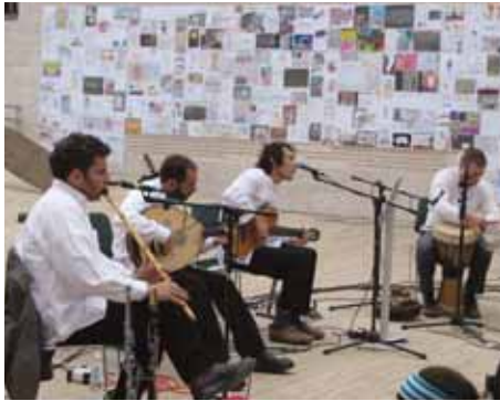
להקת "יוסף ואחד" מופיעה בכיכר המשפחה ביום הזיכרון לשואה ולגבורה ליד התערוכה "צירת זיכרון".

התלמידים השתתפו בימי עיון ביד ושם ונעזרו בצוות מגמת ההדרכה. לשלב הסיום נשלחו 16 סרטים – כמה מהם סרטי עלילה קצרים, אחרים תיעודיים ומעטים הם סרטי דוקו-דרמה. בטקס הוקרנו הסרטים והוכרזו שמות הזוכים שבחרה ועדת השיפוט.