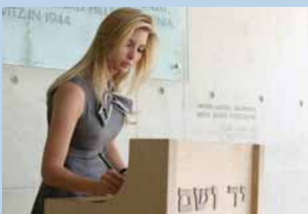
ביציאתה מאנדרטת "יד לילד" חתמה אשת העסקים והדוגמנית איוונקה טרמפ בספר האורחים.