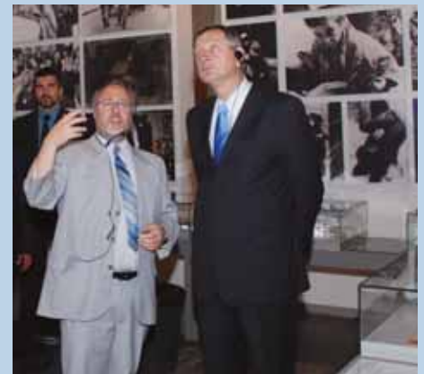
נשיא הרפובליקה של סלובניה ד"ר דנילו טורק (מימין) סייר במוזאון לתולדות השואה בלוויית מנהל הספריות ביד ושם ד"ר רוברט רוזט (משמאל).