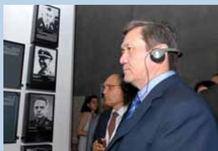
נשיא מונגוליה נמבר הנקבאואר ביקר במוזאון לתולדות השואה.