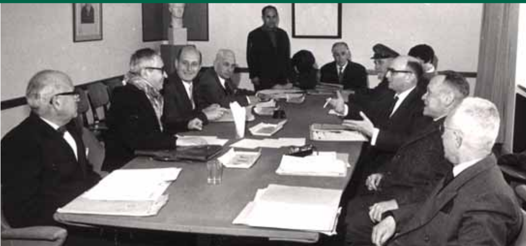
אחת הישיבות הראשונות של הוועדה לציין חסידי אומות העולם