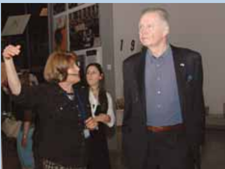
השחקן האמריקני זוכה פרס האוסקר ג'ון וויט (מימין) סייר מודרך במוזאון לתולדות השואה.