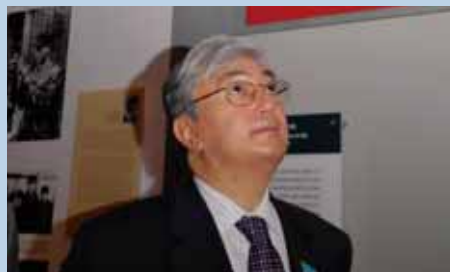
יושב ראש הסנאט של בית הנבחרים של קזחסטן קאסימ-ג'ומרט טוקאייב ביקר במוזאון לתולדות השואה.