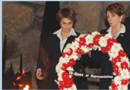
יושבת ראש בית הנבחרים של ארצות הברית ננסי פלוסי (מימין) ביקרה ביד ושם בלוויית חברי קונגרס. בביקור הניחו ננסי פלוסי ויושבת ראש הכנסת דליה איציק (משמאל) זר בטקס זיכרון באוהל יזכור.