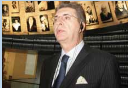
נשיא האספה הכללית של האו"ם סרז'אן קרים ממקדוניה ביקר בהיכל השמות בסיור ביד ושם.