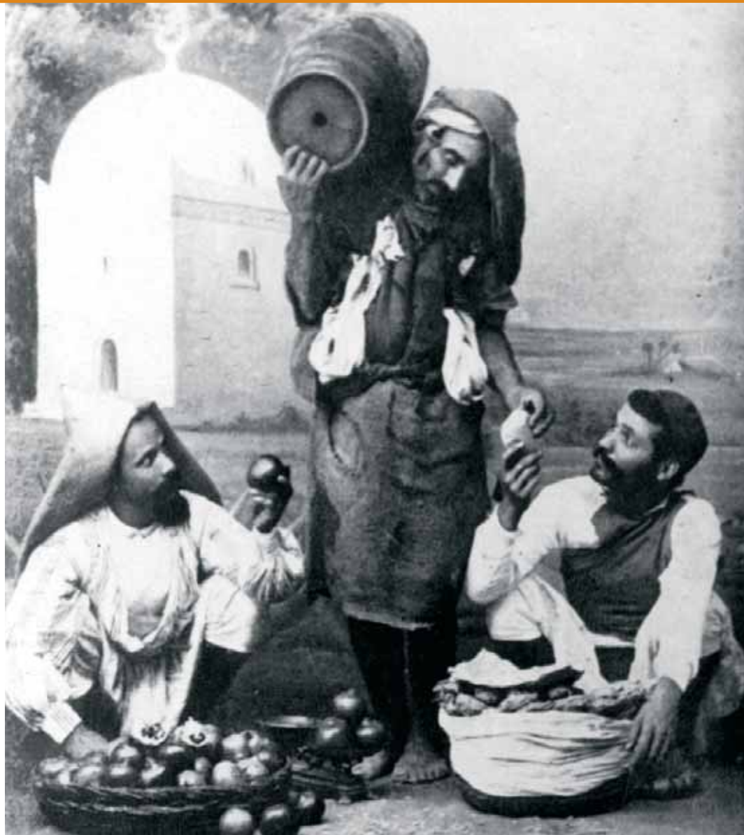
■ תוניס: שלושה יהודים לפני מלחמת העולם השנייה

לתכנית המלאה של הכינוס: www.yadvashem.org הכינוס יתקיים בתמיכתו של מרכז גרטנר לכינוסים בין-לאומיים.