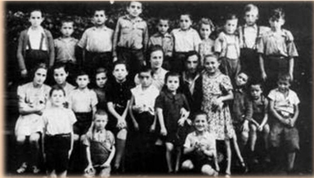
תצלום קבוצתי לפני הנסיעה לארץ ישראל, לודז', פולין, 1947

רבים מן הניצולים העדיפו לעזוב את אירופה משום שהייתה קשורה בזיכרונם לאירועי השואה. חלקם בחרו לעלות לארץ. בשיעור זה בחרנו להתמקד בילדים שעלו לישראל.