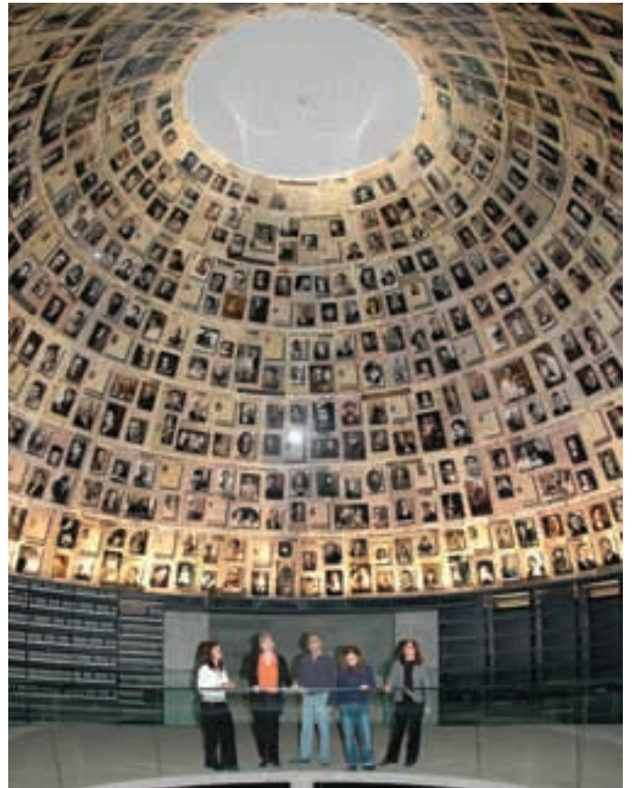
Une vue de la Salle des Noms.

En 2014, la base de données des noms a été élargie pour faciliter l'accès aux nombreuses informations contenues dans les dossiers de Yad Vashem relatifs aux Juifs persécutés durant la période de la Shoah. Des renseignements sur des victimes qui n'avaient pas été enregistrées jusqu'alors ont été ajoutés. Parmi celles-ci figurent également des personnes dont le sort reste à éclaircir. Cela inclut, par exemple, les informations concernant la moitié des 1,5 million de Juifs ayant fui ou ayant été évacués vers le centre de l'URSS suite à l'opération Barbarossa, déclenchée le 22 juin 1941. Selon toute probabilité, un grand nombre d'entre eux n'ont pas survécu. Les efforts accomplis pour obtenir des informations fiables attestant de leur sort se poursuivent. Aujourd'hui, plus de quatre millions et demi de noms sont accessibles sur le site Internet de Yad Vashem et d'importants travaux de recherche entrepris dans l'ancien bloc de l'Est complètent sans cesse la Base de données.