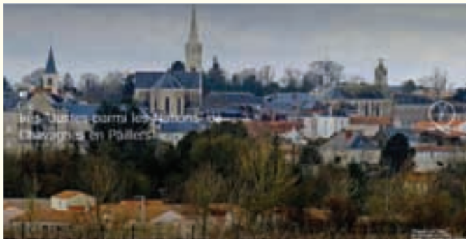
Exposition numérique Cavagnes en Paillasson.

Le site internet du Comité Français , mis en ligne en 2012, est complémentaire avec le site en français de Yad Vashem, lancé le 23 mars 2017 à Paris.