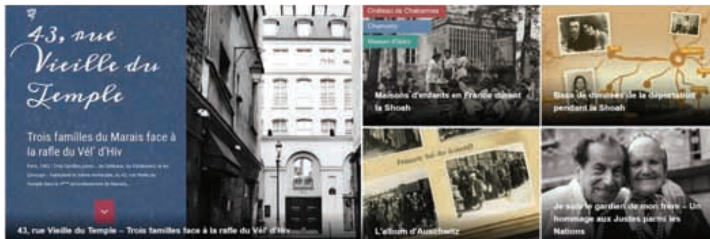
Page d'accueil du site internet de Yad Vashem en français.