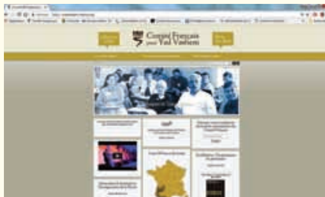
Site Internet du Comité Français pour Yad Vashem.

essentielle pour permettre au plus grand nombre d'avoir accès à ces informations.