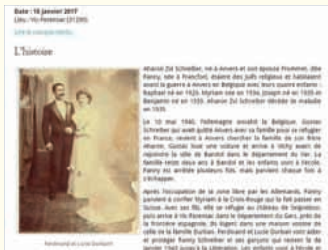
Base de données des Justes de France sur le site du Comité Français pour Yad Vashem.