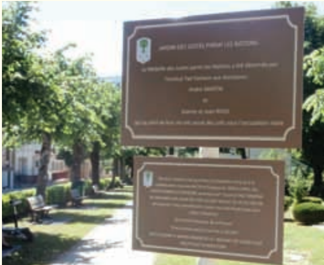
Jardin des Justes parmi les Nations à Annot.