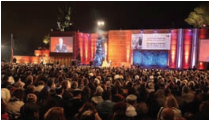
Vue générale de la cérémonie de Yom Hashoah.