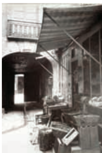
Vue du 43 rue Vieille du Temple

lettres, cela nous a permis de découvrir leur monde intérieur et le destin des Juifs pendant la Shoah. Cela fait plus de 60 ans que Yad Vashem rassemble de précieuses lettres comme celles-ci, dans le monde entier. Certaines d'entre elles sont accessibles sur le site Internet de Yad Vashem en français.