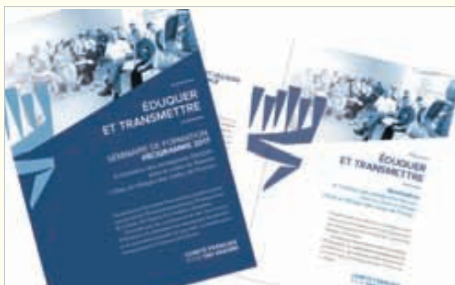
Séminaire pour enseignants.

occasion vont financer en partie les deux premiers séminaires planifiés, en juillet et en octobre 2017, pour lesquels les candidats sont déjà très nombreux.