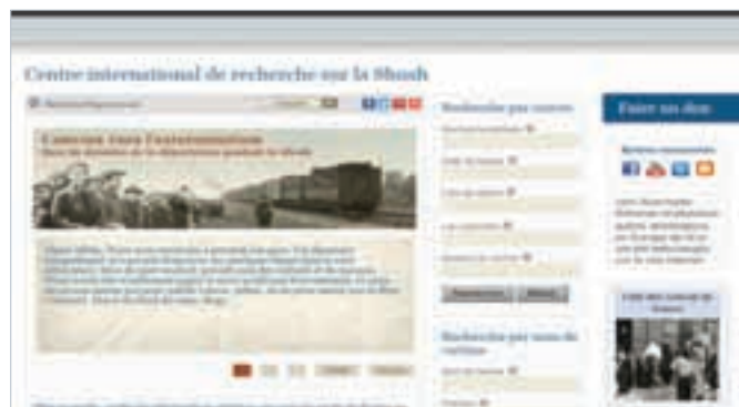
Base de données des déportations.

Le site Internet de Yad Vashem enregistre déjà plus de 18 millions de visites par an. La version française permettra de rendre le travail et les ressources de l'Institut accessibles au public francophone en France et à travers le monde.