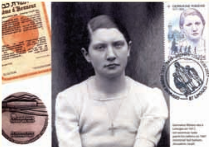
Carte-souvenir philatélique Germaine Ribière.

Les 10 et 11 mars 2017, la Poste de Limoges Brantôme a rendu hommage à Germaine Ribière, Juste parmi les Nations, avec l'émission d'un timbre à son effigie.