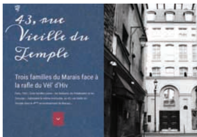
Page d'accueil de l'exposition virtuelle "43 rue Vieille de Temple"

Si l'histoire des habitants du 43 rue Vieille du Temple a pu être reconstituée, c'est grâce à cette correspondance. En écrivant ces