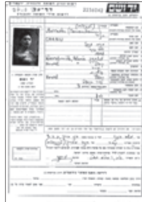
Feuille de Témoignage pour Chaniu Awruch