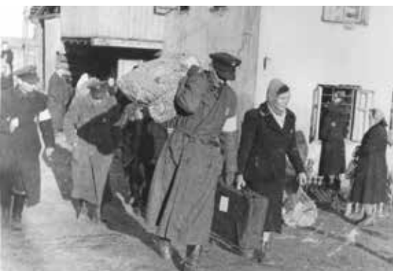
■ שוטר יהודי עוזר לפליטים יהודיים לעבור לנקודת איסוף בגטו קובנה.