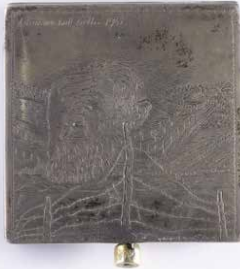
הפודרייה שהעניק יעקב סטופניקי לאשתו הצעירה טינה

הכותבת היא אוצרת משנה במחלקת החפצים באגף המוזאונים והמערך למבקר.