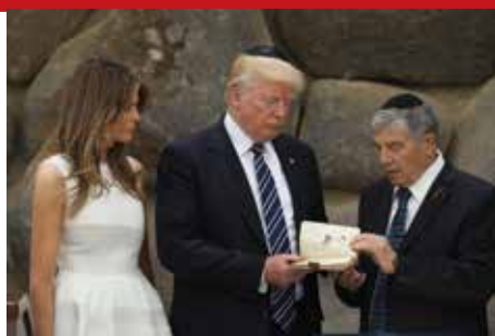
■ אבנר שלו מעניק לנשיא טראמפ רפליקה של ספר הזיכרונות של הילדה אסתר גולדשטיין שנרצחה בשואה

■ ב-23 במאי ביקר נשיא ארצות הברית דונלד טראמפ