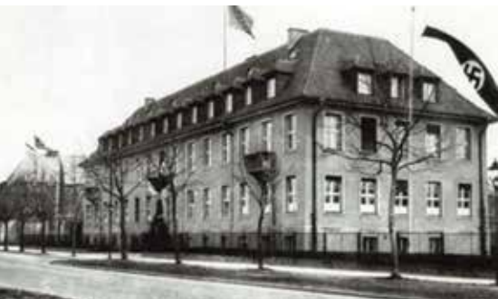
■ דגלי נאצים מונפים מעל הבניין של המכון לאנתרופולוגיה, לתורשה אנושית ולאאוגניקה של שם הקיסר וילהלם.

מנגלה וד"ר אוטמר פון פרשור, מורה רוני ותיק של מנגלה והתומך העיקרי במחקרי התאומים של מנגלה באושוויץ; והטיפול בשרידי הגופות על פי המסורת היהודית.