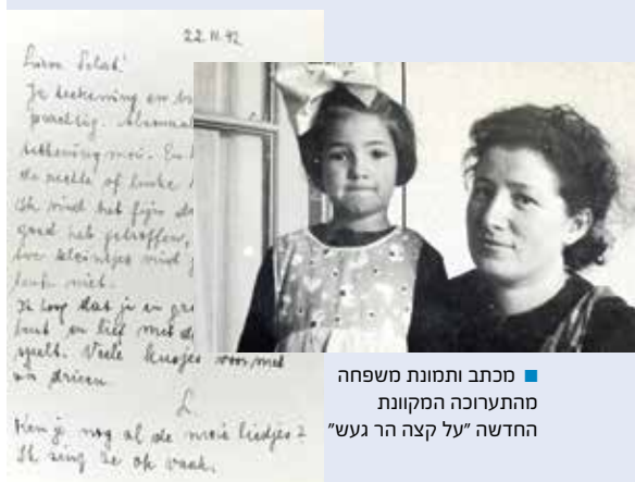
■ מכתב ותמונת משפחה מהתערוכה המקוונת החדשה "על קצה הר געש"

עשרת המכתבים המוצגים בתערוכה המקוונת החדשה של יד ושם "על קצה הר געש", במסגרת סדרת תערוכות של מכתבים אחרונים, עוסקת במכתבים אחרונים שנשלחו מבלארוס, צרפת, גרמניה, הולנד, פולין ואוקראינה ונכתבו בהולנדית, צרפתית, גרמנית, עברית, פולנית, רוסית ויידיש. חמישה מן המכתבים היקרים האלה כתבו הורים לילדיהם שלא זכו לראותם עוד. קרוביהם של היהודים הנרצחים תרמו ליד ושם את ההתכתבויות ואת תמונות יקיריהם למשמרת עולמית. כמו בתערוכות מקוונות אחרות של יד ושם, התערוכה החדשה עושה שימוש בחומרים ארכיוניים, באוספי תצלומים, בחפצי אמנות וביצירות אמנות של יד ושם. כדי להגביר את ההיבט החווייתי של תערוכה זו, חלק מן המכתבים מלווים בקריינות. אולם בכל מכתב ומכתב ובכל גלויה וגלויה שמור השריד המוחשי האישי והמיוחד של הקרבנות – כתב היד שלהם.