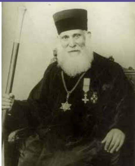
הרב משה פסח

הרב לארכיבישוף, נמשכו עד סוף הכיבוש הגרמני, ובזכותם ניצלו מאות יהודים ואפילו אלפים.