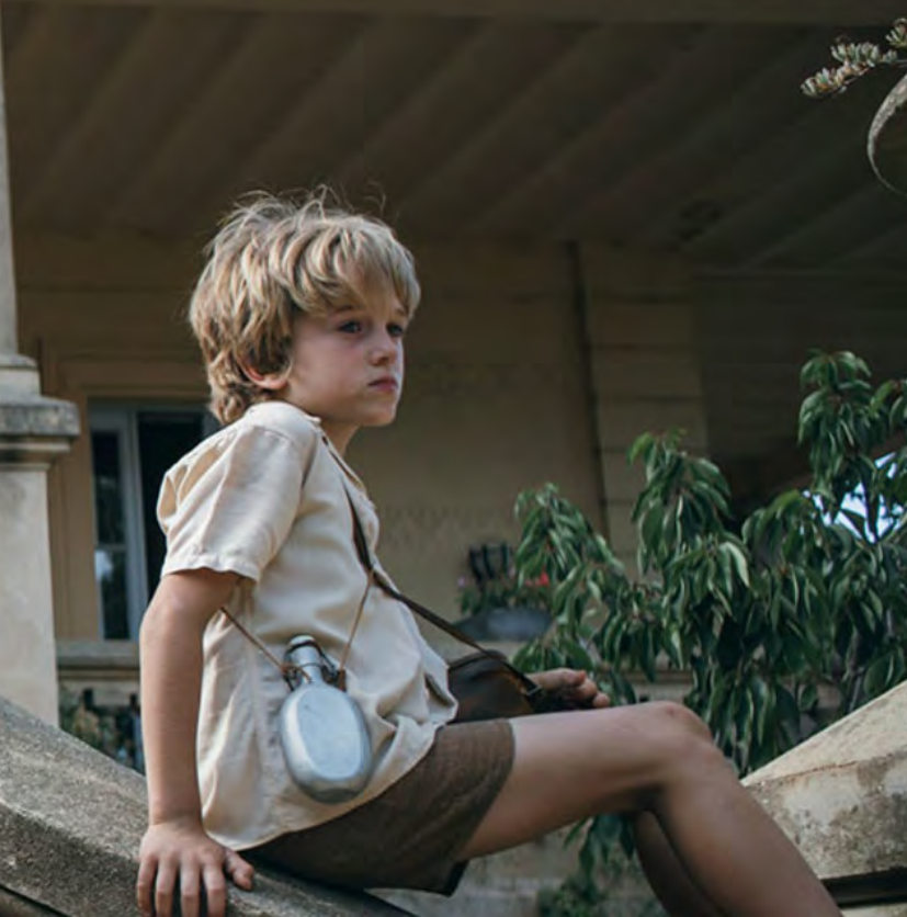
Escena de la película Española La Luz de la Esperanza , 2018

Oro" (el Oscar Holandés), entre ellos los premios a la Mejor Película y al Mejor Actor, y fue presentada para un Premio de la Academia en la categoría de Mejor Película en Lengua Extranjera en los 91 Premios de la Academia. La película ha sido acogida por Netflix.