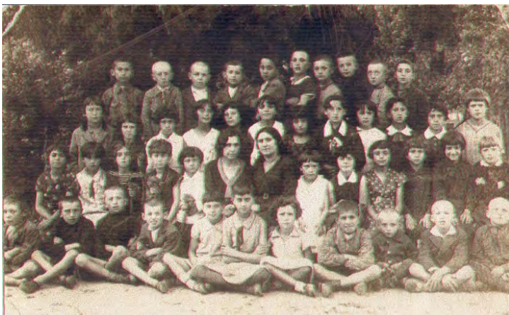
Un grupo de niños Judíos con sus maestros, Jedwabne, 1938