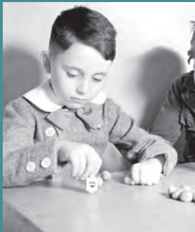
Berlín, Alemania 1930, Niño jugando con el Sevivón en Janucá