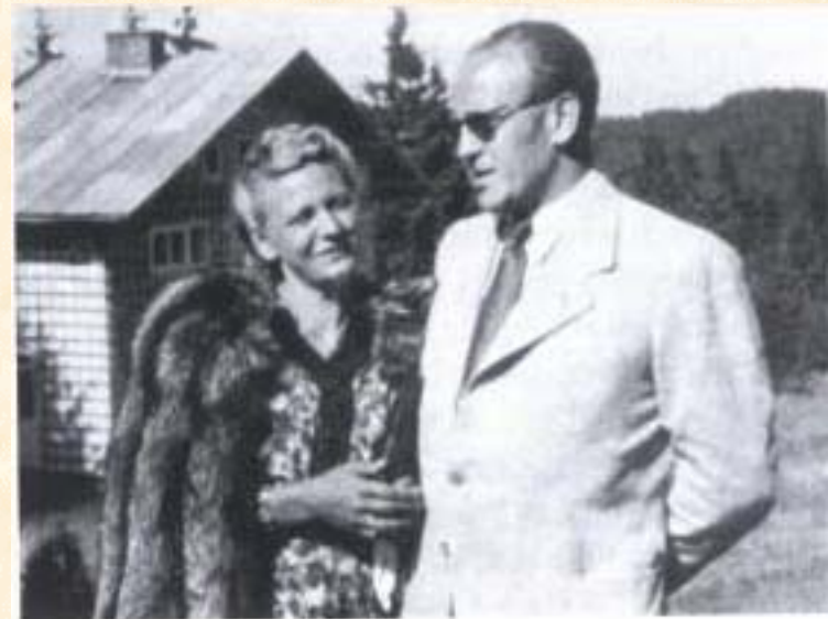
Oskar and Emilie Schindler

3 hónap elteltével 250 lengyel munkást, köztük hét zsidószármazású kényszermunkást dolgoztatott. 1942-ben munkásainak száma már 800-ra emelkedett. A hirtelen meggazdagodott Schindler hamarosan fényűző életet kezdett el élni, de munkásaival is, főleg a zsidókkal, kivételesen jól bánt.