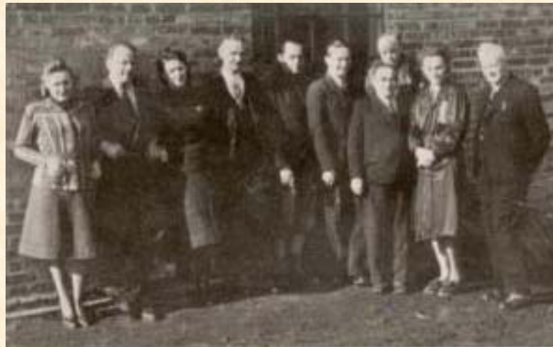
Polsische und jüdische Angestellte von Oskar Schindler in Krakau im Jahre 1940

Az önző, pénzhajszoló Schindlert egyre inkább a zsidók megmentése kezdte el érdekelni. Az általa vezetett edénygyár, a háború gazdasági érdekeit képviselve, kivételes jogokat élvezett. Zsidó munkásait azzal az ürüggyel tudta megmenteni az Auschwitzba való deportálástól, hogy hiányuk gazdasági veszteséget okozna a Német Birodalomnak. Többször meghamisította munkásai “szakmai felkészültségét” azért, hogy minnél több, nála dolgozó zsidó menthessen meg. Emiatt a Gestapó is megfigyelés alatt tartotta, és többször le is csukatta. Amikor 1944-ben 700 zsidó munkását Gross Rosen-be és Auschwitzba deportálták, Schindler, összeköttetéseit felhasználva és a Gestapót lefizetve, kiharcolta, hogy legalább a nőket megmentésük a transzporttól. Hasonló módon mentett meg feleségével, Emílievel, 120 zsidó férfit a Golezov nevű táborból. 13 zsidó megfagyott holttestét saját költségein, a helyi zsidó temetőbe temettette el. 107 túlélő testi és lelki felépülését segítette a felszabadulás után is. 1967-ben ismerték el, mint Világ Igaza. Felesége 1993-ban nyerte el ezt a kitüntetést.